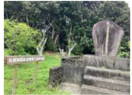
【増田の九州海軍機航空隊種子島基地跡】

8月2日の出校日には「太平洋戦争と種子島」をテーマに子供たちに話をしました。話をするにあたって、太平洋戦争のときの種子島の出来事について調べましたが、実際に経験された高齢の方に直接話を聞くともっと詳しく現実的な話が聞けるのではないかと思います。子供には難しい…と思わずに、機会があれば話を聞かせてほしいと思います。わたしの話の中では、中種子町の子供たち1600人以上がさつま町に疎開したことや、増田の飛行場建設に学生も含めた多くの人が従事したこと、6月に喜志鹿崎沖から引き上げられた旧日本軍機のこと…などについてふれました。